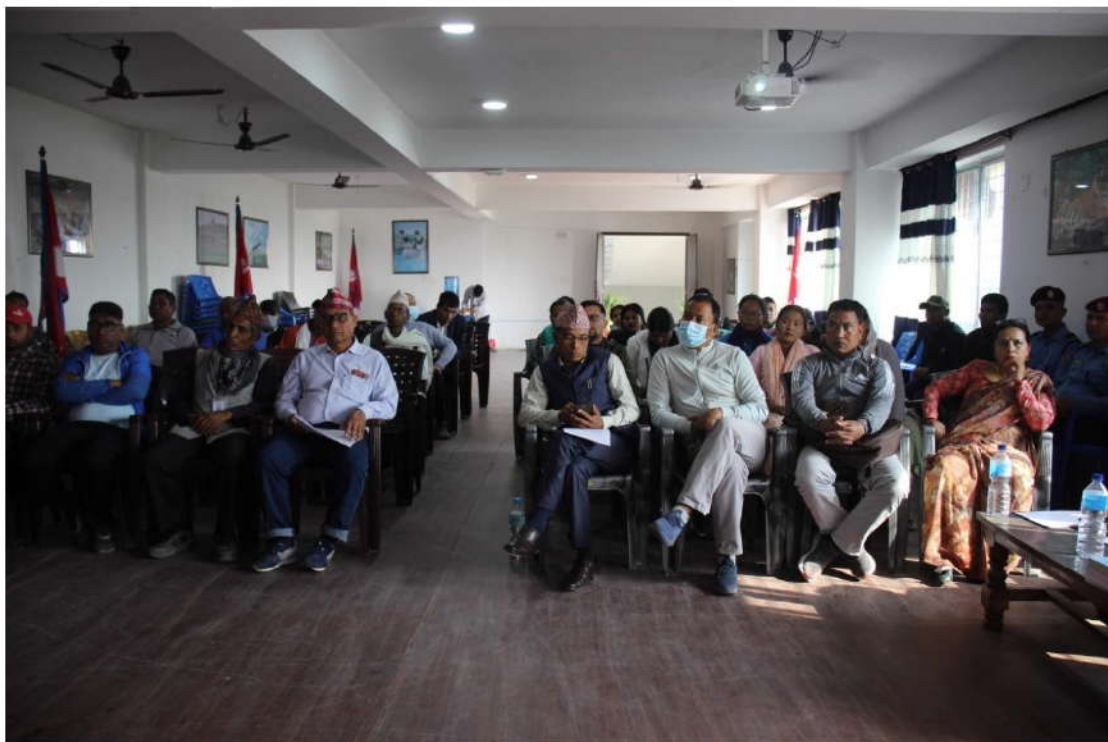
मिति २०८०।१२।१५ गते गेरुवा गाउँपालिकाको सभाहलमा आयोजित समुदायमा सरकारी वकील कार्यक्रमका सहभागीहरू